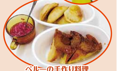
ペルーの手作り料理