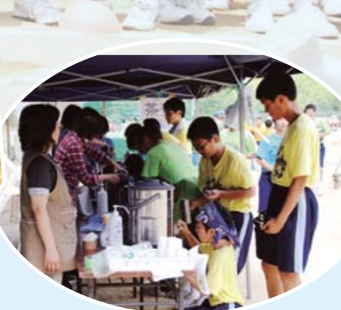
お茶サービス ありがとう!