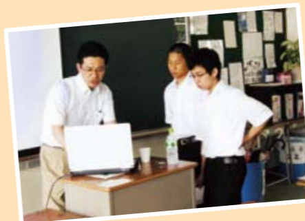
レクチャーの後も熱心に質問をする子どもたち