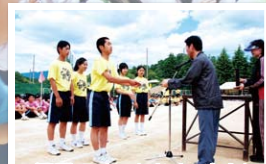
優勝 Eチームおめでとう!