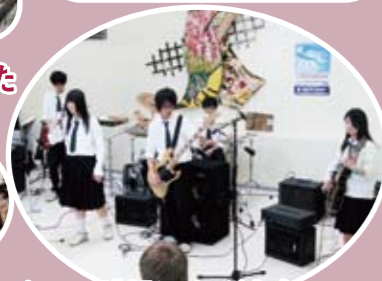
盛り上がったフォークソング部による演奏