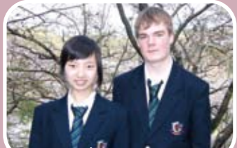
中国とデンマークから2人の留学生をむかえました