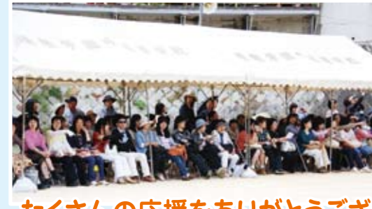
たくさんの応援をありがとうございました