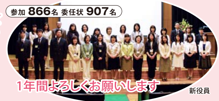
1年間よろしくお祈りします

聖書には、神様から一人ひとりに応じた賜物を与えられているとあります。人はすべて、姿・形はむろんのこと、その能力・個性も違います。 河内長野駅の清教学園の広告看板に「一人ひとりの賜物をいかす」と書かれているとおり、生徒一人ひとりの異なった賜物が本当に活かされることを願って、この年も学園における教育活動を応援していきたいと思っています。皆様方のご理解、ご協力をよろしく願います。