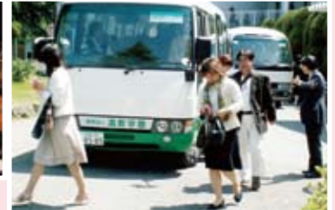
485名の方がバスを利用されました