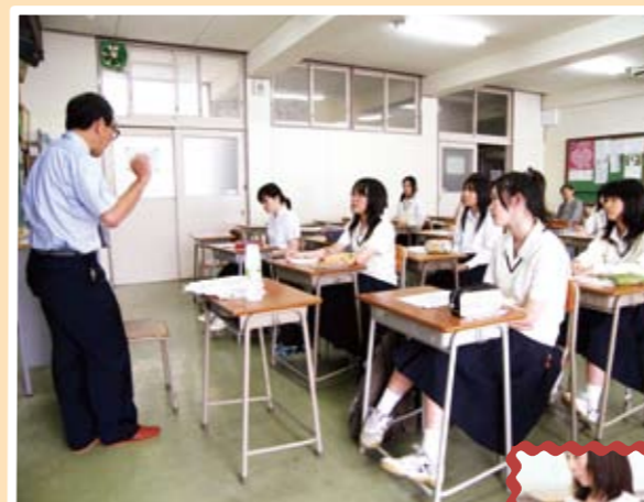
厳しい環境にいる子どもたちの実態を知ることができました