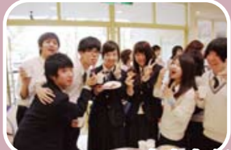
食事会も楽しみました