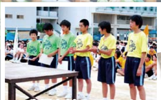
応援表彰 B・Eチーム!